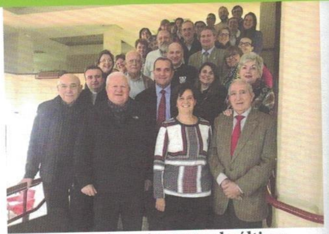
Foto de los asistentes a la última asamblea general.

La dinámica de estas actividades suele estructurarse del siguiente modo: tras una ponencia o mesa redonda y posterior diálogo, se da espacio para que cada movimiento o asociación comparta su vivencia sobre dicho argumento. Además, cuenta su presencia en las redes sociales, como herramienta útil al servicio de todos los asociados.